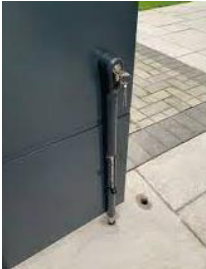
Figure 1: Verrous de sol de type Locinox